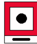
Das auf der Zusatztafel angegebene Schallsignal ist zu geben (hier ein langer Ton)