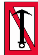
50 m vor und hinter diesem Zeichen Ankerverbot