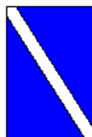
Ende einer Gebots- oder Verbotsstrecke.